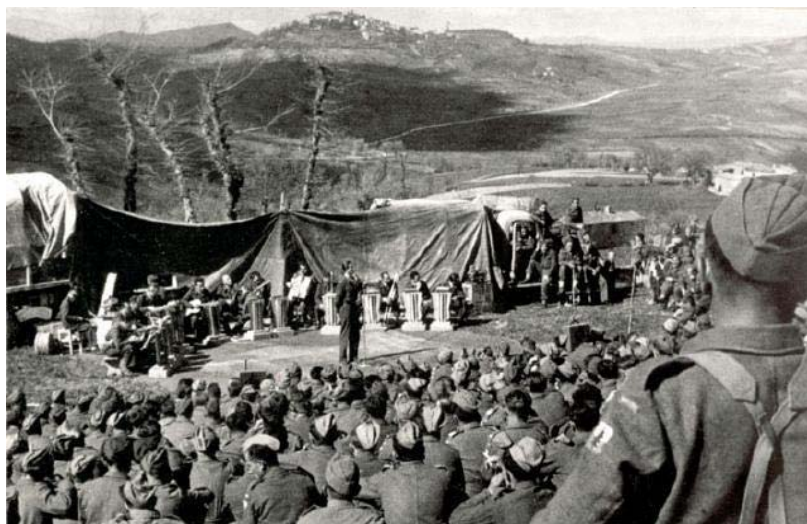
Historyczne zdjęcie z 19 maja 1944 roku: Gwidon Borucki śpiewa po raz pierwszy Czerwone Maki pod Monte Cassino