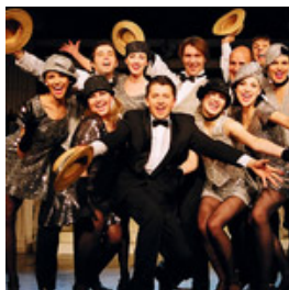
reżyseria: Janusz Józefowicz ( Złoty Liść Retro '2004)